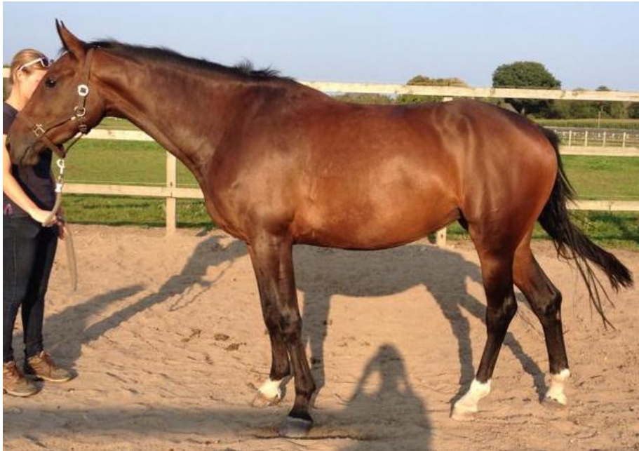
Figuur 1: Voor de behandeling