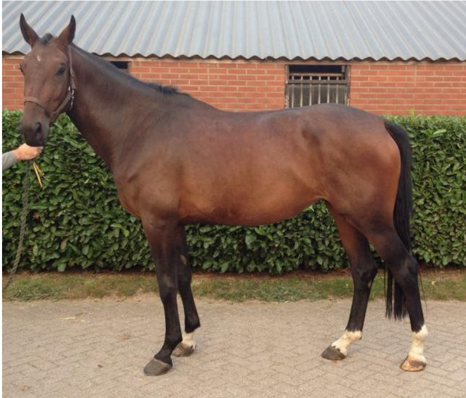
Figuur 2: Na de behandeling

De eerste foto laat een 3 jarige merrie zien voor behandeling, zij was zeer schrikachtig. De voorbenen zijn duidelijk achter de schouder, en dragen dus te veel gewicht. Dit kan leiden tot blessures in de voorbenen. Haar achterbeen is erg steil en ze zet haar knieën op slot en kantelt haar bekken naar achteren. Dit betekent dat het paard de achterhand niet kan gebruiken zoals bedoeld.